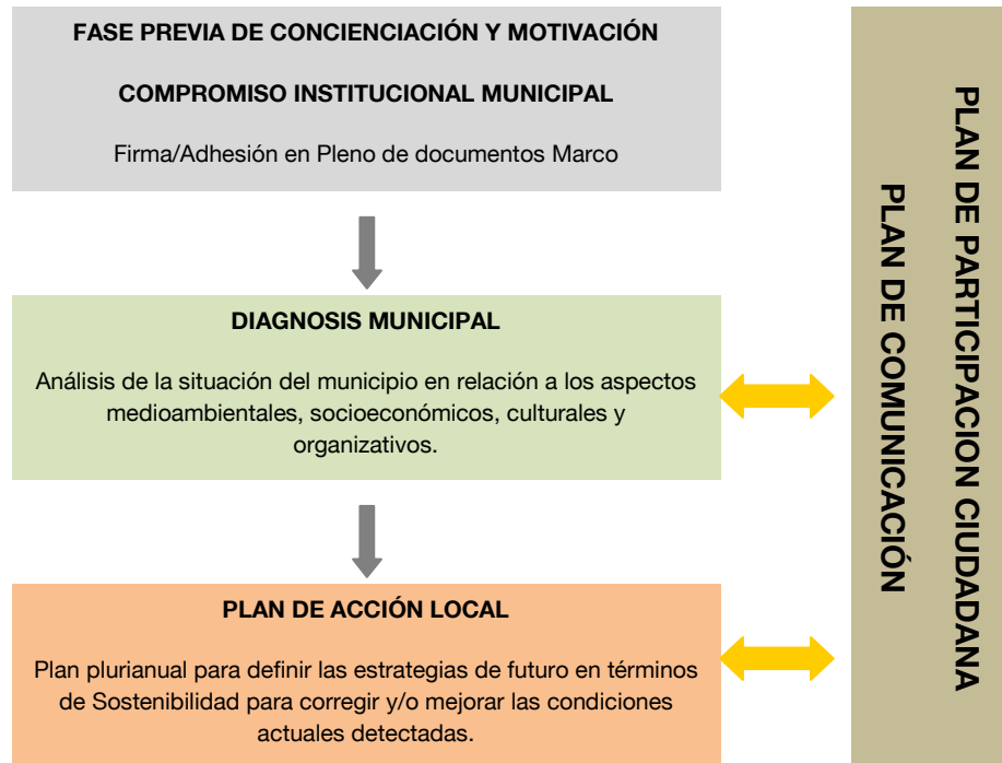
Diagrama de las Fases del proceso de A21